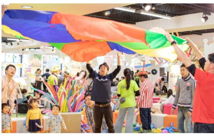
【バラバルーンの様子】