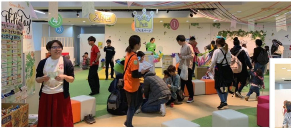
【げんきパーク外からの様子】