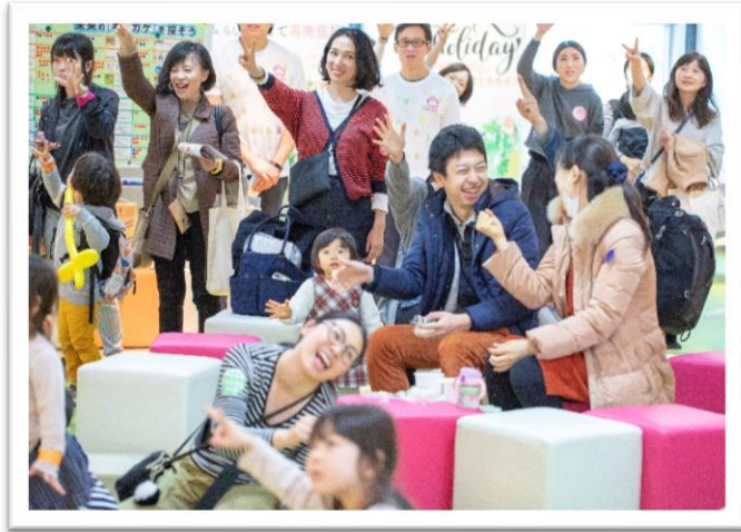
【スイカ親善大使“ママカラ”の「スイカサンバ!」 with くまモン】