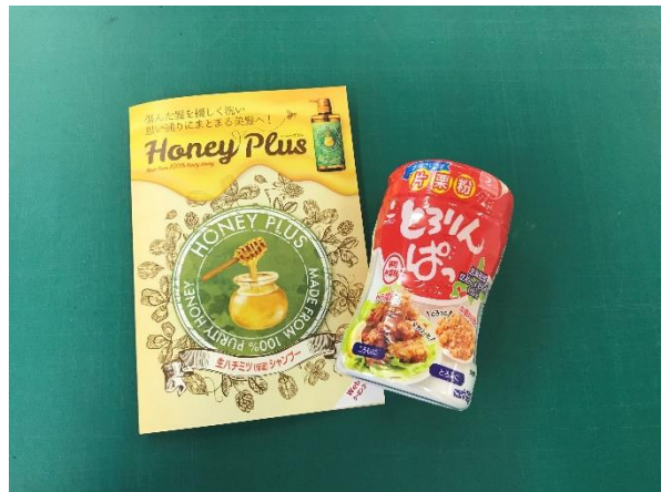
【抽選601～900までのお客様用】