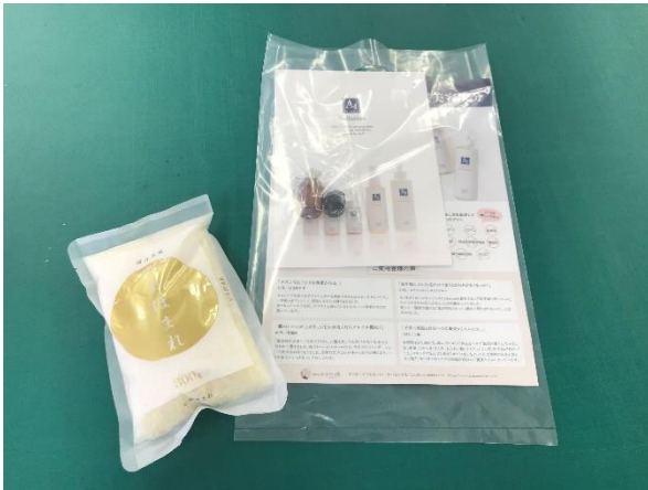
【抽選001～300までのお客様用】