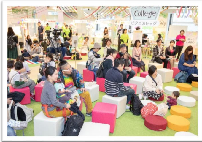
【ステージプログラムのお客様の様子】