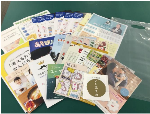
【全員プレゼント フライヤー】